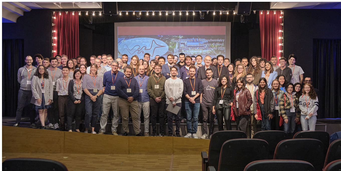
Partecipanti alla scuola 'Spectroscopy and Electrochemistry Summer School' (SPEC2024)

sito web: https://www.disc.chimica.unipd.it/spec_school [16]