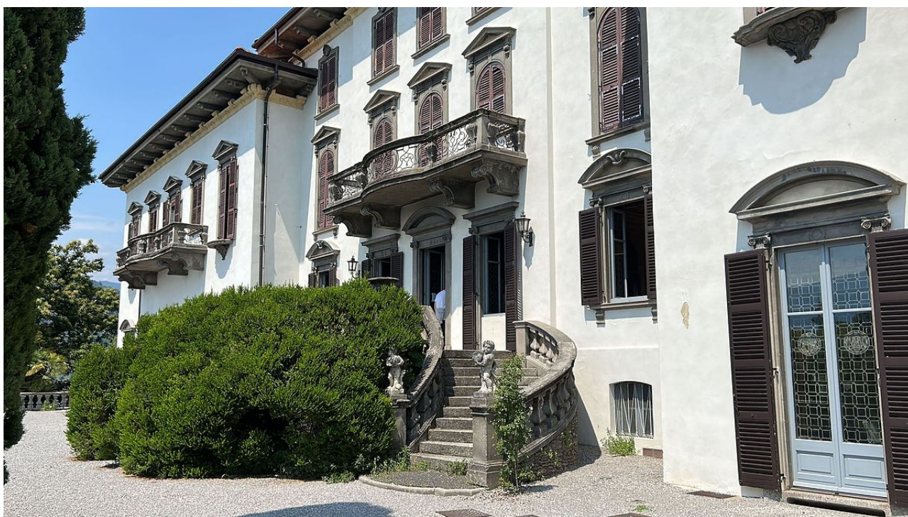
Sede della Scuola di Chimica Fisica 2023

Si è conclusa con successo la scuola di Chimica Fisica 2023 dedicata ai nanomateriali e nanostrutture. Ricercatori di alto profilo internazionale hanno approfondito aspetti di sintesi, caratterizzazione avanzata e nuove applicazioni dei nanomateriali (qui sotto alcune foto dell'evento).